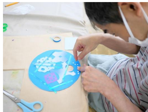
【夏のうちわ:制作の様子】