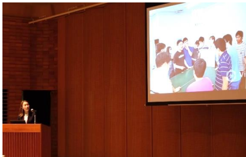
【 動画をつくり、活動の様子を紹介しました 】

令和5年度から立ち上げた相談支援部では、その経緯とともに、サービス等利用計画の作成、他機関との連携、入所・実習・事業所異動などを担っていることを報告しました。また、通所事業所での利用者異動の目的、根拠などを改めてご説明し、ご理解とご協力をお願いしました。