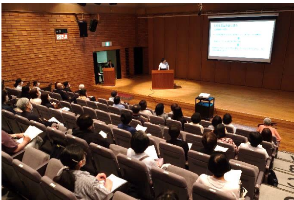
【 沢山の方々に伺いました 】